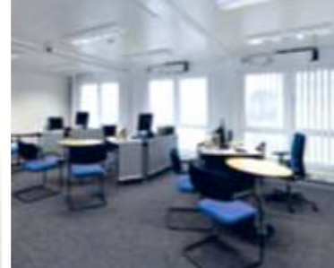
CONFORTO E ESTÉTICA