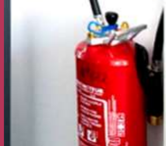
SEGURANÇA E PREVENÇÃO DE RISCOS